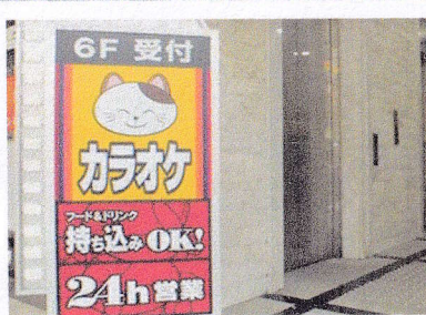
③まねきねこ（カラオケ） 安い。国別の歌が多い。 応援用のものがたくさんある 対応言語：日本語