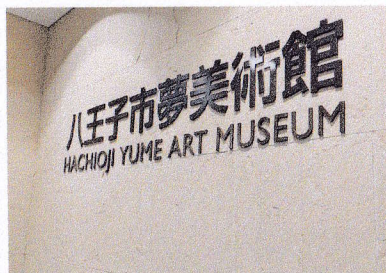
⑨夢美術館 日本や外国の文化や歴史に 芸術を通して触れる。 対応言語：多言語