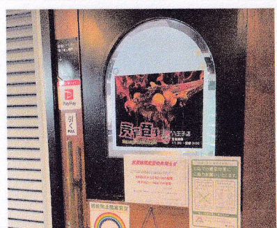
②寛窄巷子（中華料理） 中国人ぴったりのお店 対応言語：中国語、日本語