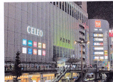
⑩セレオ八王子 日本だけでなく中国や 韓国の料理が気軽に買える。 対応言語：日本語