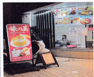
⑦味の美（中華料理） 中国東北の軽食、本格的な味 対応言語：中国語、日本語