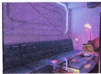
④黄金時代（カラオケ） 中国の歌がたくさんある。 飲み放題、時間無制限 対応言語：中国語、日本語