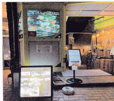
⑧コムサイゴン（ベトナム料理） 本場のベトナム南部料理 対応言語：ベトナム語、日本語