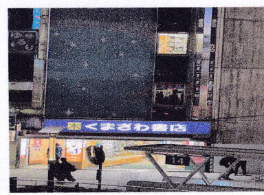
⑤くまざわ書店 本の種類が揃っていて、 すごく安い。 対応言語：日本語