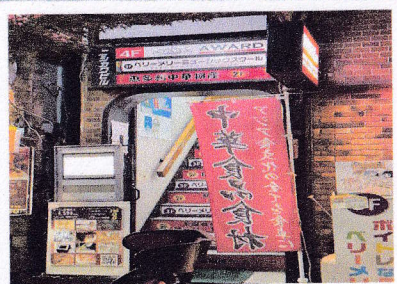
①恵多利中華物産 中国の輸入品が豊富で、 値段が安い。 対応言語：中国語、日本語